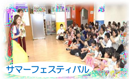
サマーフェスティバル